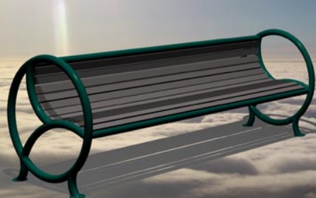
Bänk i metall med trä, ryggstöd och handtag